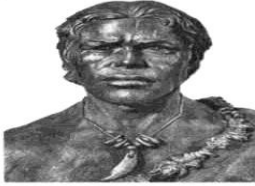
Рис. 2.2. Кроманьонец. Реконструкция М. М. Герасимова

88. На рисунке изображен кроманьонец – это человек...