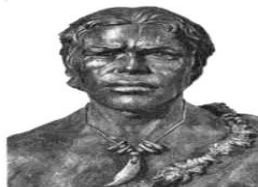
Рис. 2.2. Кроманьонец. Реконструкция М. М. Герасимова